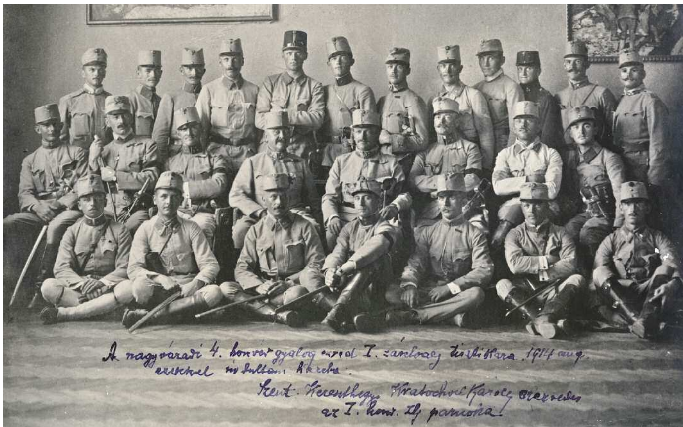
A nagyváradai 4. honvéd gyalogezred I. zászlóalj tisztikara, 1914 aug. ezredet vezényelt a katonák köré. Képz.: Keresztény, Kratochwill Karoly vezényelt az I. honv. II. parancsra!