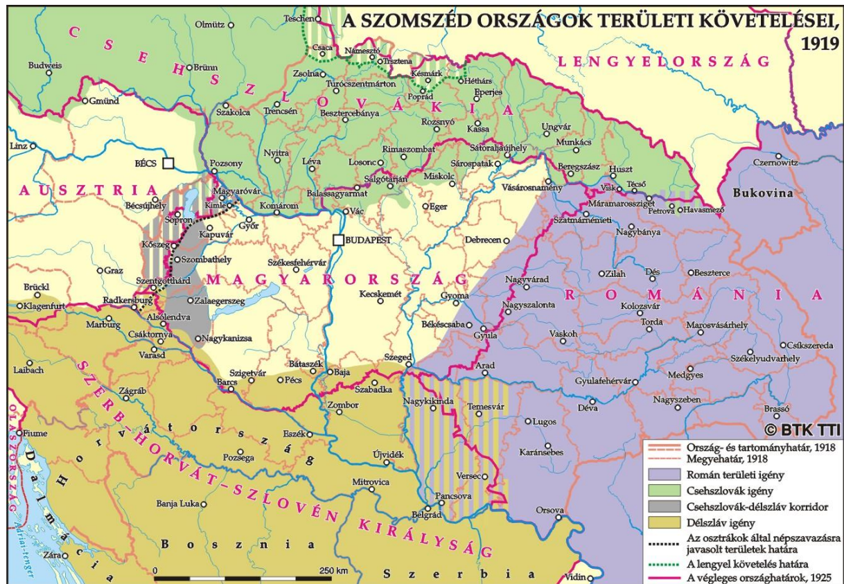
A szomszédos országok területi követelései (Nagy Béla munkája. Forrás: https://tti.abtk.hu/terkepkek )

Felvetették azt is, hogy szükség lenne egy Ausztriát és Magyarországot elválasztó területre, valamint Csehszlovákia számára egy biztonságos kijáratra az Adriához. Hasonló stratégiai (és részben gazdasági) megfontolásokkal magyarázták Prágában azt a követelésüket, hogy nyugaton a Duna legyen a magyar határ, északkeleten pedig a Börzsöny és a Mátra hegyvonulatai, mert csak ezeket a vonalakat lehet jól védeni. Nyilvánvaló, hogy aki így érvel, bár névleg békét köt, de a szomszédos országban nem jövőbeli partnert, hanem folyamatos ellenséget lát. A békekonferencia az első követelést elfogadta, de a másodikat nem, és a hegyvidék Magyarországé maradt.