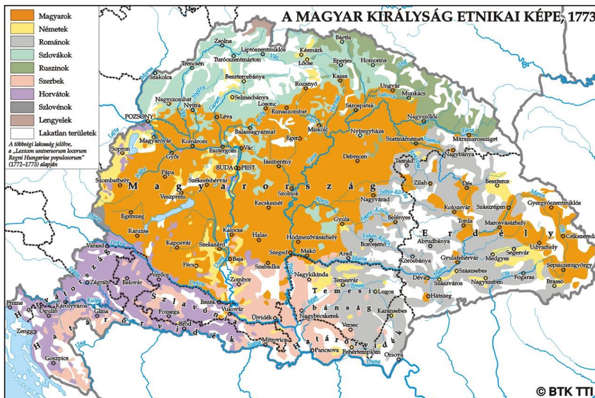
A Magyar Királyság etnikai képe a 18. század második felében (Nagy Béla munkája. Forrás: https://tti.abtk.hu/terkepek/ )